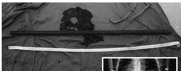
患者体内取出的钢筋