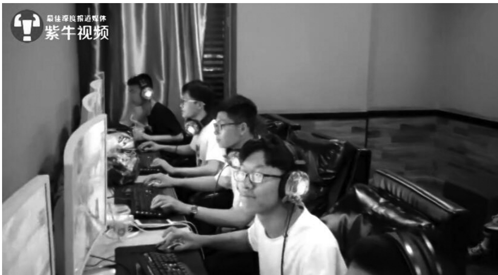
高考结束后,班主任网吧包场,请同学们打游戏,大家玩得不亦乐乎。

“别人家的班主任,真是太棒了,这也是同学最后一次能全都聚在一起的机会了,好好珍惜吧!”“这位老师值得尊敬和怀念。”“这样的班主任给我来一打。”“我们班主任让我们一个班的人去他办公室对答案。”“老师是一个很有爱心的人,他了解同学们的心理,这样考完了可以轻松很多。”“我是第一批90后,10多年前高中的时候,我们是任何娱乐的东西都是绝对被禁的,学校就是冷冰冰的地方,学校班级根本不会组织任何有娱乐性的东西,所以我的精神娱乐世界是很空泛的,特别想给这样的老师点赞!”紫牛新闻记者注意到,截至昨天下午,“班主任带全班学生通宵玩游戏”的话题网上阅读量已达3.7亿次,有4万多名网友参与讨论。绝大多数网友都认为这样的班主任值得点赞,还有网友戏称其为“中国好班主任”。