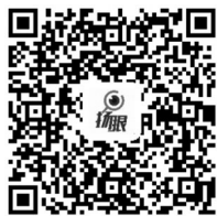
扫描二维码看国际博物馆日全省文博活动精选项目

全省将有多家文博场馆在博物馆日期间免费开放，其中南京有10家在5月18日免费开放：太平天国历史博物馆(瞻园)、六朝博物馆、江宁织造博物馆、南京民俗博物馆(甘熙故居)、南京市博物馆(朝天宫)、南京古生物博物馆、南京国防园(免费开放至26日)、南京永银钱币博物馆、江宁区民俗博物馆(杨柳村古建筑群)、南京市直立人化石遗址博物馆。当天，多家博物馆还将举行“博物馆奇妙夜”活动，观众可提前预约参加。