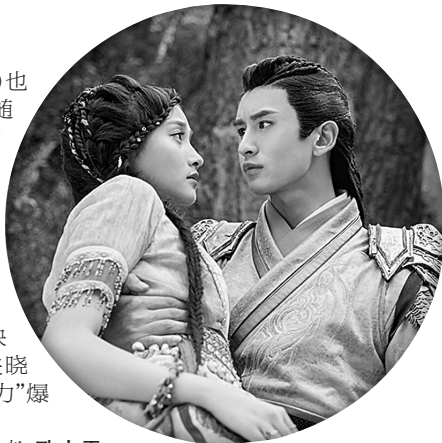
《轩辕剑之汉之云》剧照